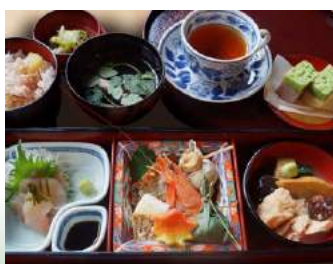
◆ 夕顔弁当 兼六園三芳庵 加賀産茶せり付