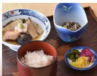
◆ じぶ煮定食 万清亭