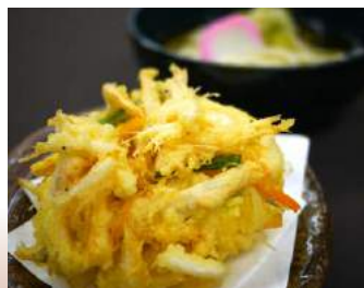
◆ 白海老のかき揚げうどん or そば 茶屋見城亭