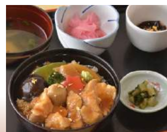
◆ ミニ治部丼 加賀産茶せり付 城山亭