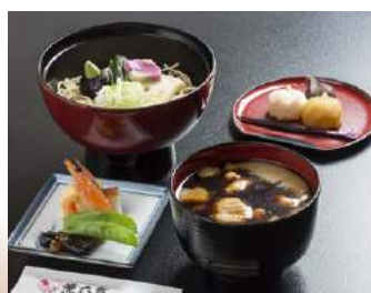
◆ つくじぶそば定食 兼六亭