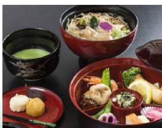
◆ たまひめ定食 兼六亭