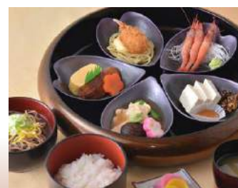
◆ 百万石園遊膳 寄観亭