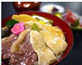
◆ 鴨と鶏の治部煮丼 (お刺身付き) 茶屋見城亭