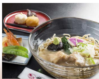
◆冷しじぶそば定食 兼六亭