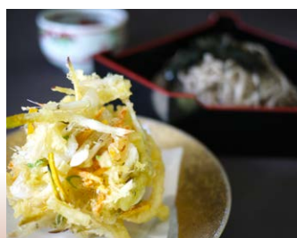
◆かき揚げざるそば or ざるうどん 茶屋見城亭