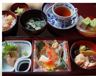
◆夕顔弁当 兼六園三芳庵 加賀産茶せり付