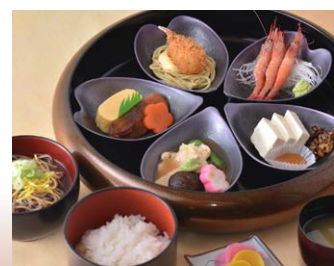
◆百万石園遊膳 寄観亭