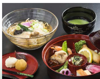
◆たまひめ定食 兼六亭