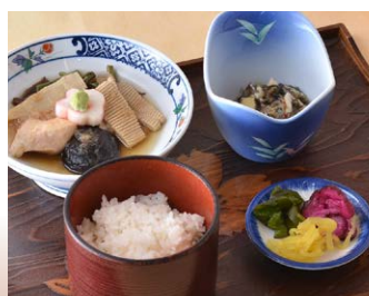
◆じぶ煮定食 万清亭