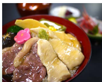
◆鴨と鶏の治部煮 茶屋見城亭 (お刺身付き) (お刺身付き)